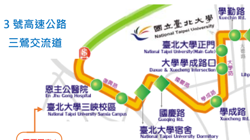
下三鶯交流道後公車停靠站